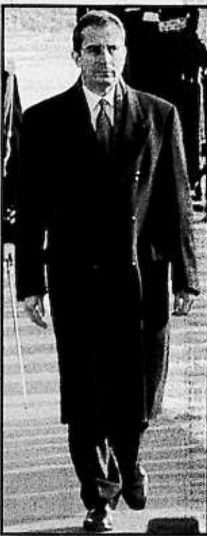
Entrevista con la radio de EU.

Oppenheimer reiteró los puntos de vista que incluye en el libro que este año escribió sobre México, y dijo que los Estados Unidos deben ser más maduros en su relación con este país y tratarlo como un socio comercial, como lo hacen los países de la Unión Europea.